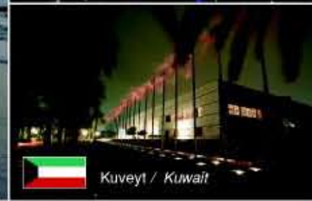
Kuveyt / Kuwait