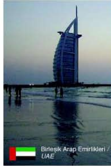
Birleşik Arap Emirlikleri / UAE