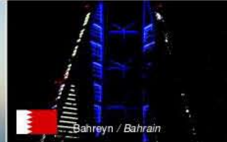
Bahreyn / Bahrain